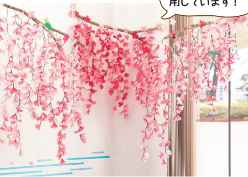
(使用色: 紅桃、桃色、桜、白、ぼたん)